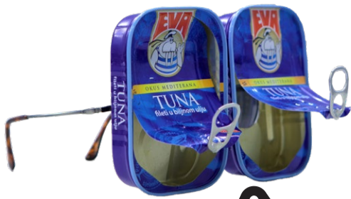
eva drugarica mornareva Renata Svetić